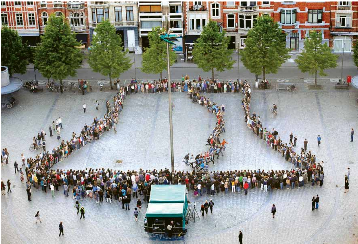
■ Levende klok. Sensibilisering voor de beiaardcultuur in Vlaanderen

is als ICE en een andere niet. Het gevaar bestaat ook dat het levende erfgoed om een of andere reden wordt 'bevroren' in een bepaalde vorm/van een bepaald moment – bv. door folklorisering of als gevolg van het prat gaan op een bepaalde 'authenticiteit'. In dergelijke gevallen neemt de economische waarde de overhand op de sociale waarde. 25